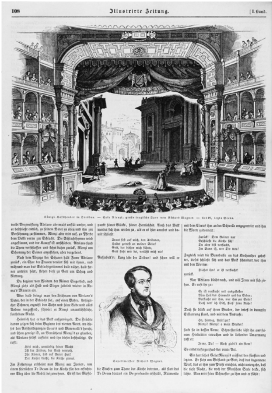
Abb. 1: Illustrierte Zeitung vom 12.08.1843, S. 108.