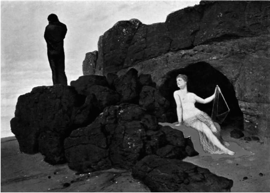
Abb. 4: Arnold Böcklin: Odysseus und Kalypso , 1883, Öl auf Holz, 104 x 150 cm, Kunstmuseum Basel, Inv.-Nr. 108

Sowohl vor als auch hinter der Architektur aus Stein und Vorhängen entstehen Bildräume, die einen Widerstreit zwischen Opazität und Transparenz sichtbar machen. Dabei wird dieser als ein künstliches Szenario gezeigt, indem ein Bühnenraum entworfen wird, innerhalb dessen Objekte, Figuren und Skulpturen ihre Plätze eingenommen haben. Mit der Einfügung der Backsteinmauer veranschaulicht das Gemälde die symbolische Struktur der Architektur. Der binäre Wechsel von Anwesenheit und Abwesenheit, Erscheinen und Verschwinden verdoppelt sich zugleich mit den beiden schwarzen Vorhängen. Innerhalb dieser symbolischen Struktur, die im Bild mit den Mitteln von Architektur und Vorhängen organisiert ist, kommt zweitens die Dimension des Imaginären ins Spiel. Wie eine geöffnete Tür ermöglicht der beiseitegeschobene Vorhang links im Bild eine transparente Aussicht auf eine Stadtlandschaft, die zur kontemplativen Betrachtung einlädt. Diese Position wird von der Rückenfigur eingenommen, die zugleich der Versunkenheit des Subjekts vor Bildern entspricht. Diese Disposition im linken Bildteil folgt der imaginären Dimension, die die Position eines Auges konstituiert, das wie aus einem Fenster schauend über die Welt herrscht und die Dinge erfasst. Im Gegensatz zu einem imaginären Bildverständnis, das bereits zu einer Erstarrung des Subjekts geführt hat, führt de Chirico drittens im rechten Bildteil das letzte