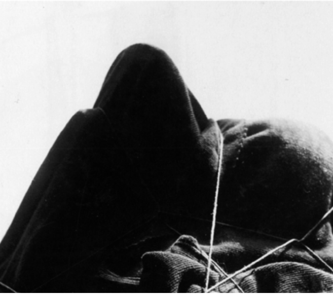
Abb. 1: Man Ray: L'enigme d'Isidore Ducasse , 1920, Silbergelatineabzug, 9,9 x 11,7 cm, Sammlung Andrew Strauss, Paris

bildnis des Künstlers handelt, der entlang der Straße, in der das Atelier sich befand, sein verhülltes Objekt hinter sich herzieht. Die proportionalen Dimensionen im Bild lassen dabei diese Fracht auf dem Karren monumental groß und schwer erscheinen. Das verhüllte Gebilde wurde nicht nur fotografiert und gemalt, sondern zuletzt auch als Objekt ausgestellt. Es fand seine Form als surrealistisches Objekt, wie viele autorisierte Repliken Man Rays. Erstmals als Objekt wurde es sechzehn Jahre nach seiner fotografischen Entstehung, also 1936, im Rahmen der Exposition surréaliste d'objets gezeigt. Zur Ausstellung erscheint ein Katalog, der sämtliche ausgestellten Objekte