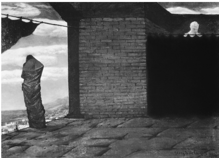
Abb. 5: Giorgio de Chirico: Das Rätsel des Orakels, 1909, Öl auf Leinwand, 42 x 61 cm, Privatbesitz

Register ein. Indem man nicht genau weiß, was sich alles hinter dem Vorhang verbirgt, und auf diese Weise ein Leere entsteht, wird neben dem Imaginären auch auf die Dimension des Realen hingewiesen. Dies geschieht mit der Einführung der Opazität, die als solche kenntlich gemacht wurde. Es handelt sich dabei nicht um eine verschlossene Tür, die gar keinen Einblick ermöglicht, sondern um einen zugezogenen Vorhang, der, wie in vielen Gemälden de Chiricos, mithilfe einer niedrigen Mauer ein Objekt als ein Halbverstecktes erscheinen lässt: in diesem Fall eine weiße Skulptur. Das Werden des Objekts beginnt sich genau an dieser Stelle zu artikulieren.